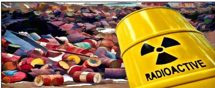
Gambar 9 : Tapak Pembuangan Sisa Toksik

Permohonan adalah daripada Kementerian Sumber Asli dan Alam Sekitar (NRE) mana-mana agensi lain yang berkaitan atau mana-mana pihak yang dilantik.