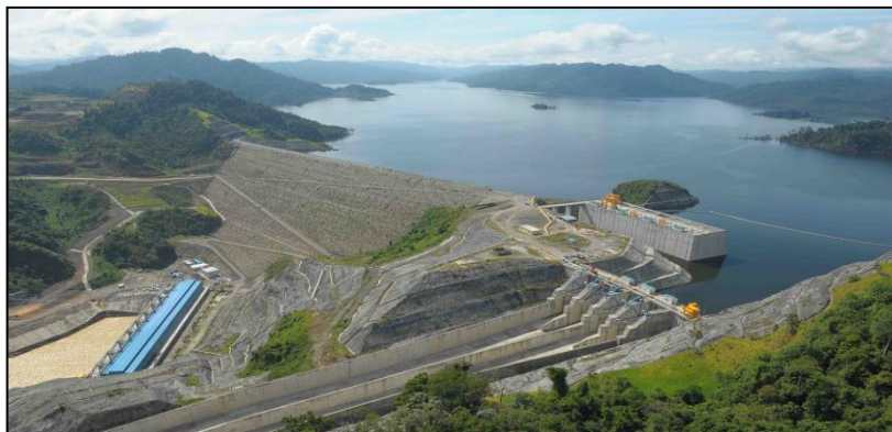
Gambar 8 : Empangan

Permohonan adalah daripada Jabatan Bekalan Air (JBA) TNB, KeTTHA, MOA, mana-mana agensi lain yang berkaitan atau mana-mana pihak yang dilantik