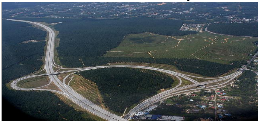
Gambar 6 : Lebuh Raya

Permohonan adalah daripada KKR, LLM, mana-mana agensi lain yang berkaitan atau mana-mana pihak yang dilantik.