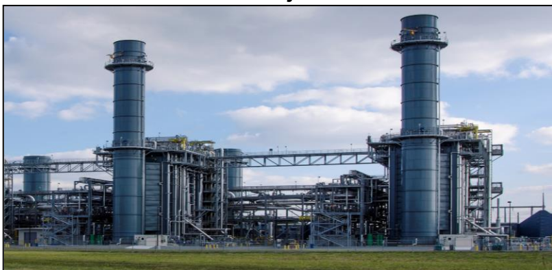
Gambar 7 : Loji Jana Kuasa

Permohonan adalah daripada KeTTHA, TNB, agensi nuklear, mana-mana agensi lain yang berkaitan atau mana-mana pihak yang dilantik.