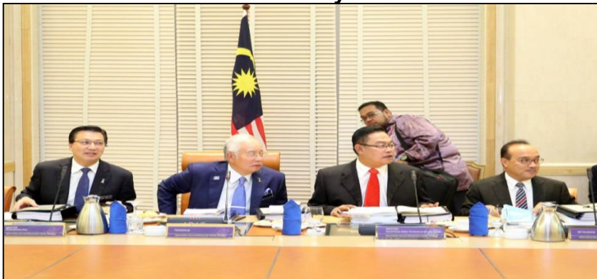
Gambar 10 : Mesyuarat MPFN

Istilah “2 Negeri” dalam bab 4.0 merujuk kepada semua Negeri-negeri Persekutuan di Semenanjung Malaysia dan termasuk Wilayah Persekutuan Kuala Lumpur dan Putrajaya.