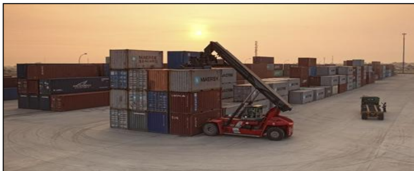
Gambar 4 : Pelabuhan Darat

Permohonan adalah daripada MOT, mana-mana agensi lain yang berkaitan atau mana-mana pihak yang dilantik.