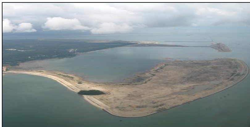
Gambar 1 : Aktiviti Penebusgunaan Pinggir Laut